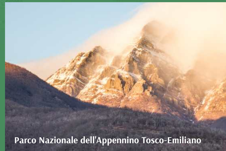
Parco Nazionale dell'Appennino Tosco-Emiliano