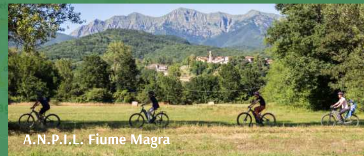
A.N.P.I.L. Fiume Magra

Environment and landscape. From the peaks of the Apennines to the bottom of the Magra valley, the territory of Filattiera has a unique landscape and cultural richness, included within the Unesco MAB Area of the Tuscan-Emilian Apennine National Park. The variety of the territory offers numerous itineraries that can be undertaken either on foot or by bicycle! To discover the trail network, consult the Lunigiana Bike Area website ( lunigianabikearea.com ).