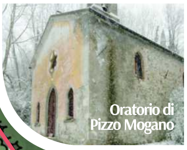
Oratorio di Pizzo Mogano

Area di San Giorgio. Sulla sommità meridionale della collina di San Giorgio, in epoca medievale, sorgeva una grande fortificazione che comprendeva una cinta muraria, una torre di avvistamento a base quadrata e una chiesa. Oggi si conservano la torre e la chiesetta di San Giorgio, probabilmente edificata quando venne abbandonata l'area di Sorano sita nel fondovalle. La chiesa mantiene le sue forme originarie e conserva al suo interno la celebre epigrafe tombale risalente al 752 d.C., narrante le imprese del missionario Leodegar, uomo di fede che ebbe un ruolo determinante nella diffusione del cristianesimo in Lunigiana.