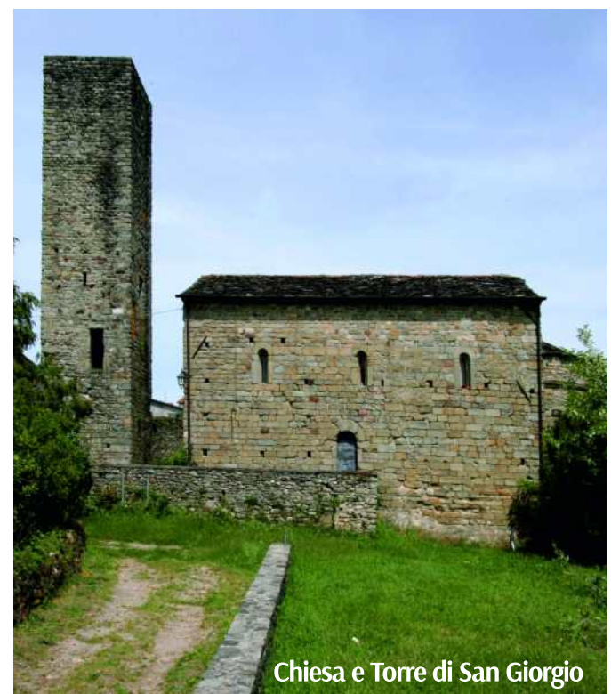
Chiesa e Torre di San Giorgio

Oratory of Pizzo Mogano. It stands just outside the village of Filattiera and can be reached by following the Via Francigena. The building, founded in the 15th century, underwent major restoration work in the late 19th century. Inside is a valuable fresco of the Tuscan school representing the Annunciation, datable to the 15th century.